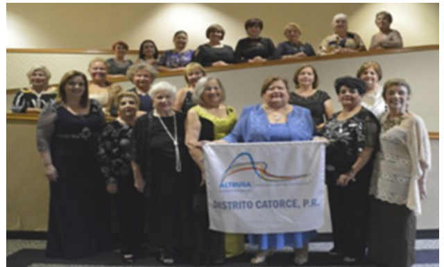
Grupo de Puerto Rico